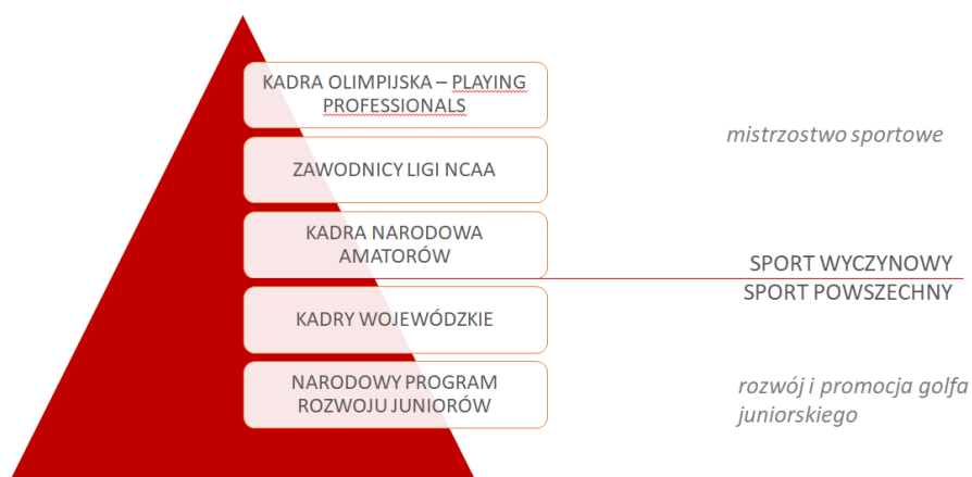
Ryc. 1: Struktura szkolenia sportowego w PZG

W ujęciu piramidowym, składa się ona obecnie z czterech kluczowych segmentów. Podstawę stanowi projekt dedykowany dla rozwoju i promocji golfa juniorskiego w Polsce – Narodowy Program Rozwoju Juniorów (sport powszechny), natomiast wierzchołek stanowi reprezentacja Polski wyłoniona w drodze selekcji z zawodników objętych szkoleniem w ramach kadry narodowej (sport wyczynowy). Działania w ramach rozwoju reprezentacji Polski i kadry narodowej realizowane są na bazie przeprowadzonej wcześniej selekcji najzdolniejszej grupy dzieci i młodzieży spośród szerokiej grupy juniorów uprawiających golfa w Polsce (ryc.1).